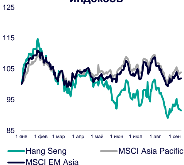
Динамика мировых индексов