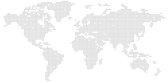
Динамика мировых индексов

Европейские площадки открыли новую неделю снижением: Euro Stoxx теряет 1,70%, CAC – 1,66%, DAX – 1,85%. Самое ожидаемое событие сегодняшнего дня – отчёт Бундесбанка об экономической ситуации в стране, сложившейся этим летом, и комментарии его представителей. В остальном – без важной макростатистики, поэтому инвесторы будут оценивать сообщения, приходящие с рынков США и Азии, а также фокусировать своё внимание на корпоративных отчётах ещё не представивших свои результаты компаний.