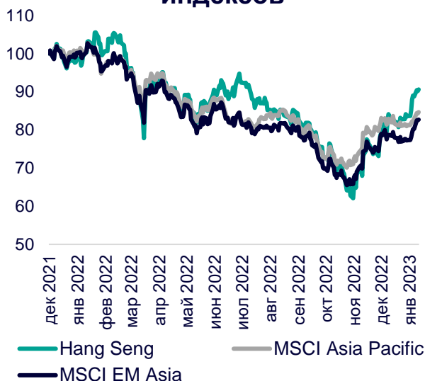
Динамика мировых индексов