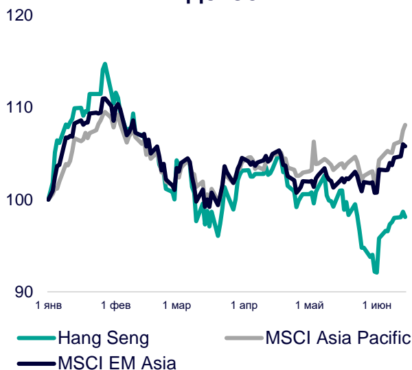
Динамика мировых индексов