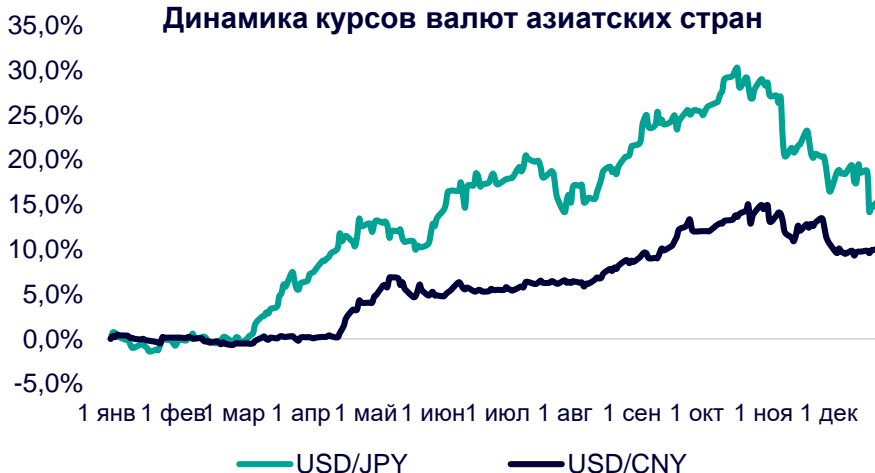
Динамика курсов валют азиатских стран

Банк Японии поспешил успокоить инвесторов после расширения коридора доходности гособлигаций и заявил сегодня, что продолжит смягчение денежно-кредитной политики. Глава регулятора Х.Курода заявил, что Банк будет стремиться к достижению ценовой стабильности устойчивыми способами, сопровождаемыми ростом заработной платы, путём дальнейшего смягчения денежно-кредитной политики в рамках контроля над кривой доходности.