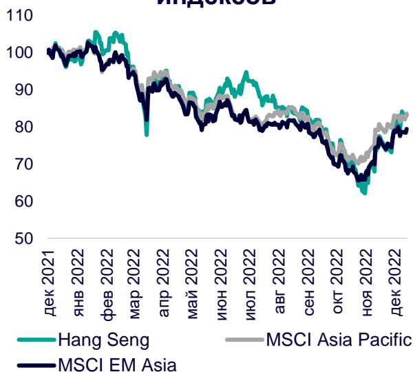
Динамика мировых индексов