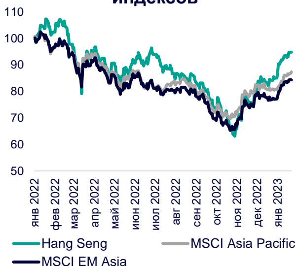
Динамика мировых индексов